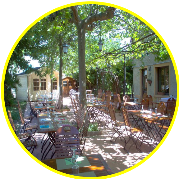
Terrasse du restaurant

17 € par personne (avec ¼ de vin et le café compris)