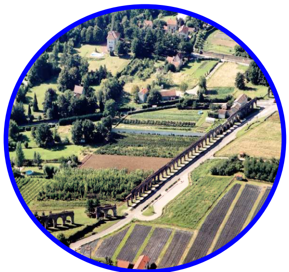
Le Site du Plat de l'Air vu du ciel ©

Chaque prestation sera réglée séparément. Le programme peut-être modulable selon vos envies. Les tarifs ne comprennent pas le transport ni les dépenses personnelles. Le repas du guide (17€) devra être pris en charge par le groupe.