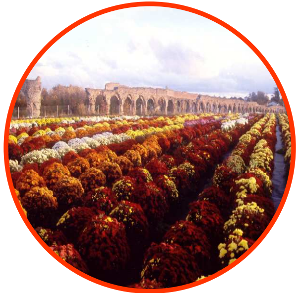
Site du Plat de l'Air - Chaponost

Le Garon, vestiges de l'aqueduc (Le Guichardet, le siphon