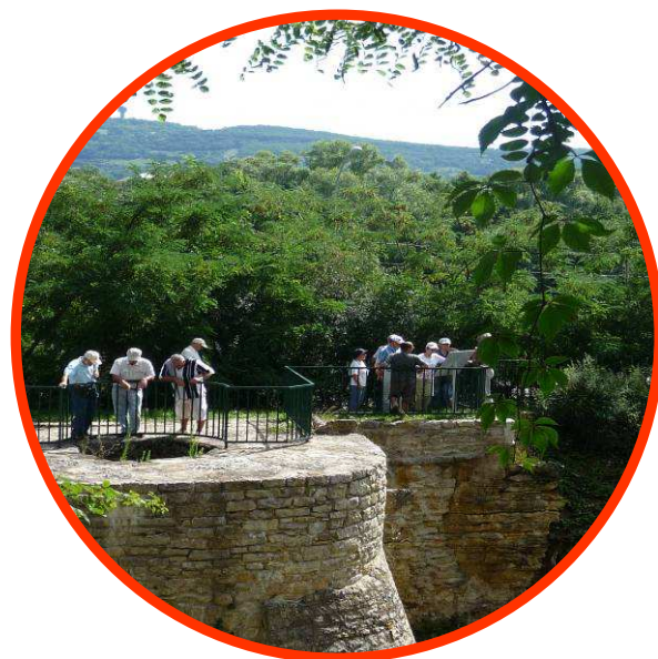
Le four à chaux

restauré par une association du village. Des explications vous seront données sur son rôle, son fonctionnement et sur le chantier de restauration.