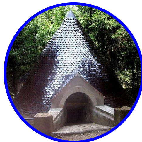
Glacière de la Tourette

Chaque prestation sera réglée séparément. Le programme peut-être modulable selon vos envies. Les tarifs ne comprennent pas le transport ni les dépenses personnelles. Réservation : minimum 3 semaines à l'avance.