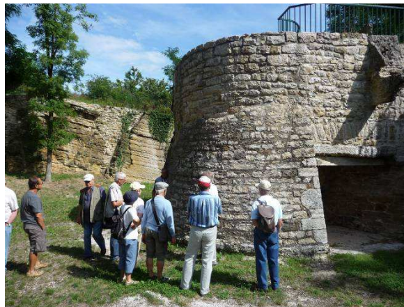
Four à Chaux de Dommartin

Tarifs calculés selon les informations connues au 26.10.11, et valables à partir de 20 personnes.