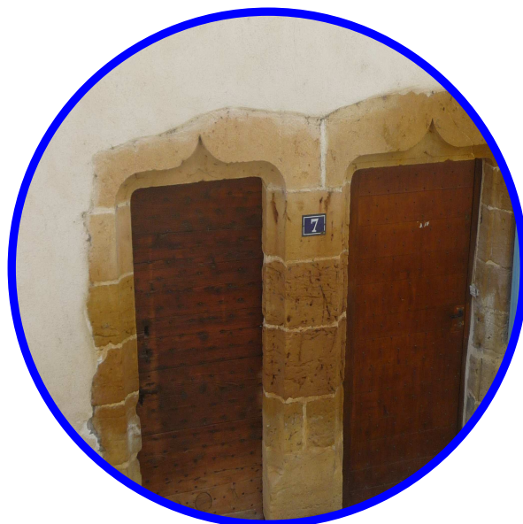
Sain Bel

Chaque prestation sera réglée séparément. Le programme peut-être modulable selon vos envies. Les tarifs ne comprennent pas le transport ni les dépenses personnelles. Réservation : minimum 3 semaines à l'avance.