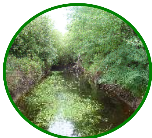
Mare - Landes de Montagny ©

Tarif dégressif selon le nombre des participants : de 8,40 € à 21 € par personne