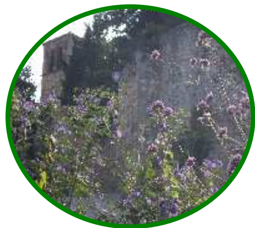
Chapelle romane - Montagny

Chaque prestation sera réglée séparément. Le programme peut-être modulable selon vos envies. Les tarifs ne comprennent pas le transport ni les dépenses personnelles.