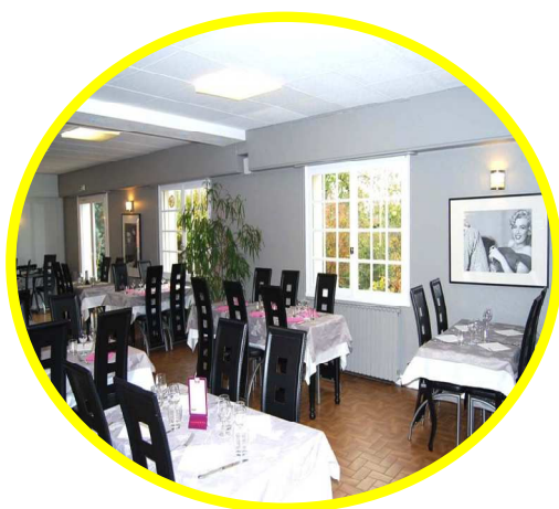
Le restaurant - Montagny

Ambiance conviviale, décoration moderne et très design se prêteront à merveille pour votre repas de groupe. Ce lieu a su marier la simplicité et l'originalité pour votre plus grand plaisir. Cuisine traditionnelle aux accents méditerranéens.