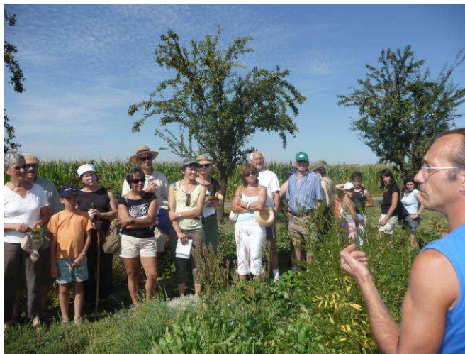
Graines d'arômes

Tarifs calculés selon les informations connues au 26.10.11, et valables à partir de 20 personnes.