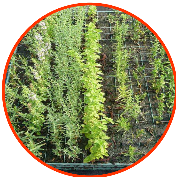
Graines d'arômes

9h30 : Bienvenue à « Graines d'Arômes » , où votre odorat sera mis en éveil, au milieu des plantes aromatiques. Vos yeux et vos oreilles seront sollicités pour observer les caractéristiques des plantes à l'aide des conseils de votre guide. Pour finir, vos papilles seront en éveil avec une dégustation de produits à base de plantes.